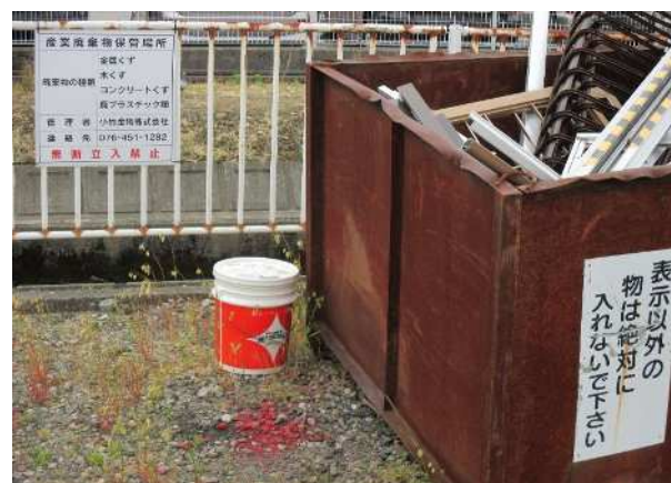
廃棄物保管場所表示