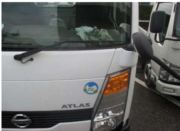
エコドライブ表示