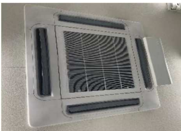
エアコンのフィルター掃除